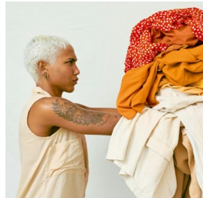
Top-Themen im kommenden forum : Bauen, Biodiversität, Innovation und Kreislaufwirtschaft